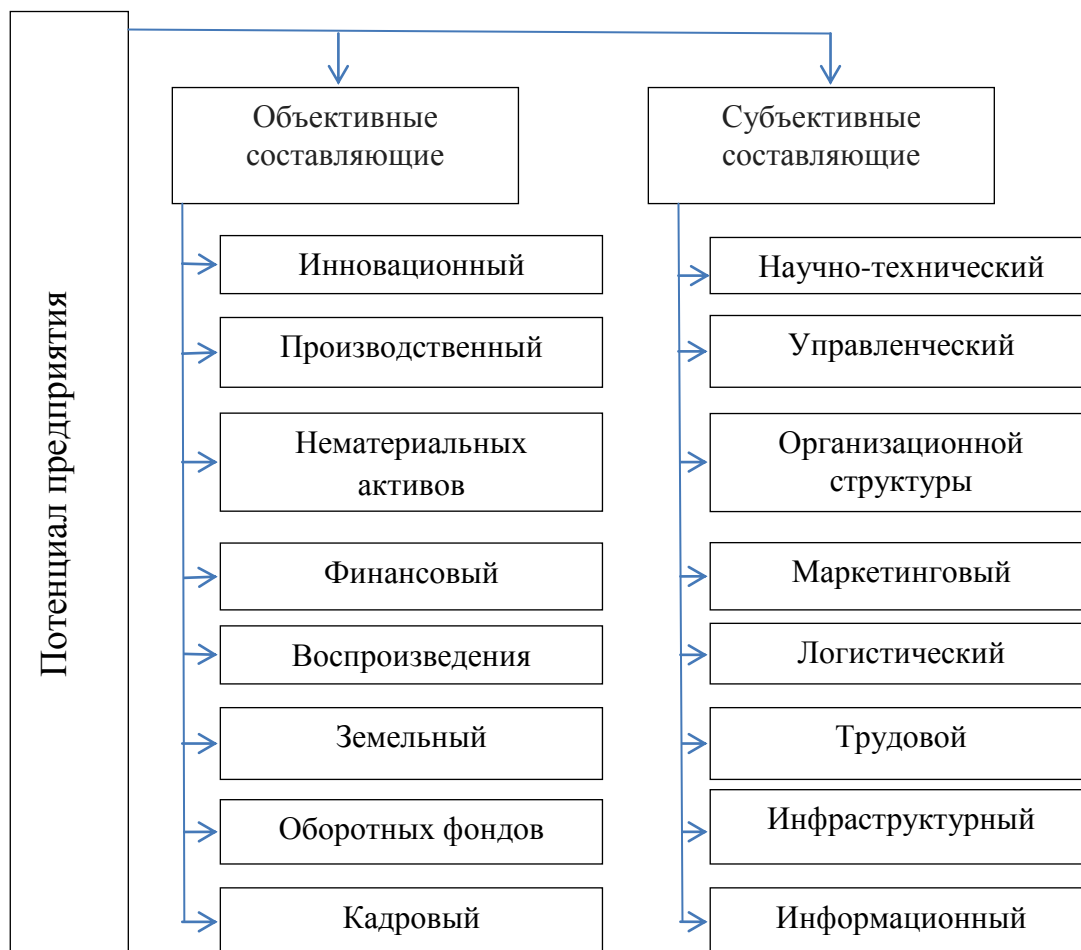
Рис. 3. Составляющие экономического потенциала предприятия

Субъективные составляющие потенциала предприятия связаны с общественной формой их обнаружения. Они не потребляются, а составляют предпосылку, общеэкономический, общехозяйственный социальный фактор рационального потребления объективных составляющих (рис. 3).