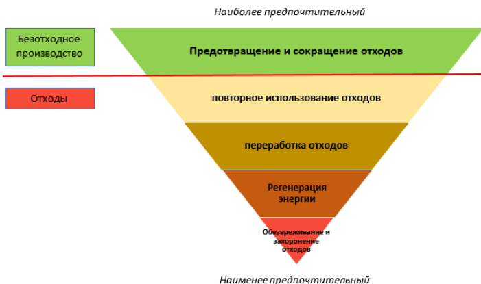
Рисунок 2 – Иерархия управления отходами

Существует ряд стратегий управления отходами. "Иерархия управления отходами" – это ранжирование стратегий, основанных на устойчивости, которое используется Европейским Союзом в его директиве по отходам (рис. 2) [6].