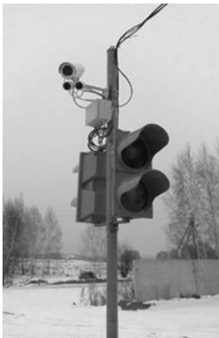
Рисунок 2 - Відеокамера системи оптичної ідентифікації

номерів по групах, інтеграція з приладами вимірювання швидкості та комплексними системами безпеки, що включають [2].