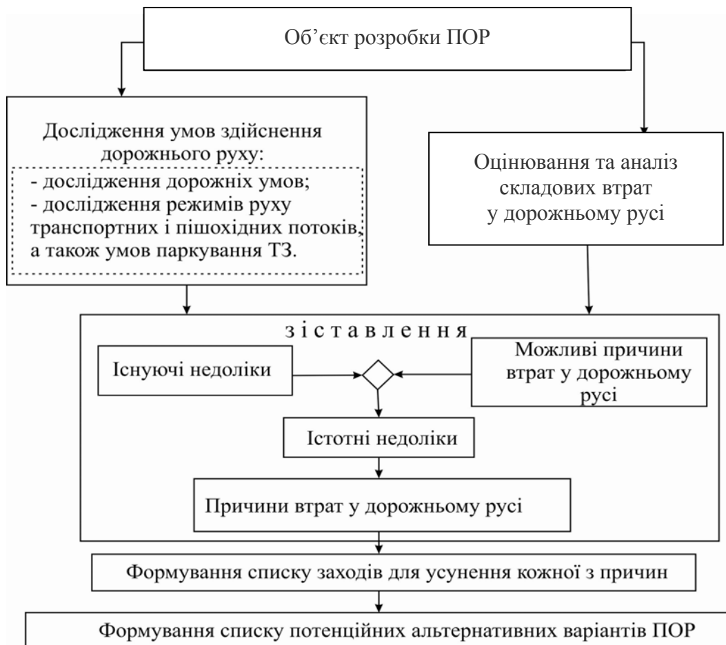
Рис. 1. Процес формування списку альтернативних варіантів проекту організації дорожнього руху

Етап 1. Процес формування списку альтернативних варіантів ПОР на об'єкті проектування недостатньо формалізований і мало описаний точними методами досліджень. Список потенційних альтернативних варіантів ПОР на об'єкті проектування рекомендується складати на основі дослідження причин втрат у дорожньому русі (рис. 1).