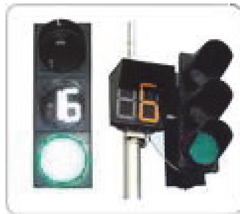
Рис. 4. Транспортный светофор с табло обратного отсчета времени

Также на некоторых пересечениях города Белгорода были установлены светофоры с обратным отсчётом времени (рис. 4). Отдельное табло показывает, сколько секунд ещё будет гореть красный и зелёный свет.