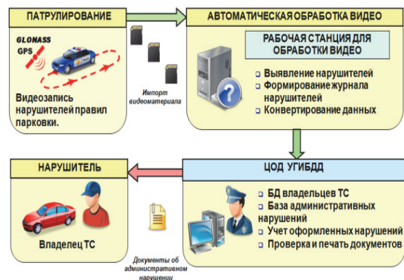
Рис. 3. Схема видеорегистрации нарушений правил парковки ТС в г. Белгороде

Сформированная база нарушителей автоматически передается в Центр обработки данных непосредственным образом, либо через блок приема и конвертации данных «РИФ». В Центре обработки данных осуществляется автоматизированная подготовка и печать постановлений по делу об административном правонарушении (рис. 3).