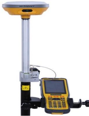
Рисунок 1 – GNSS/RTK приймач

Суть цього режиму визначення координат та висот полягає в тому, що диференційні GNSS поправки передаються з базової станції на Rover GNSS приймач по каналу бездротового зв'язку саме під час зйомки, а не обробляються після GNSS спостережень камерально (вручну). Таким чином, оператор Rover GNSS приймача отримує координати та висоти у реальному часі.