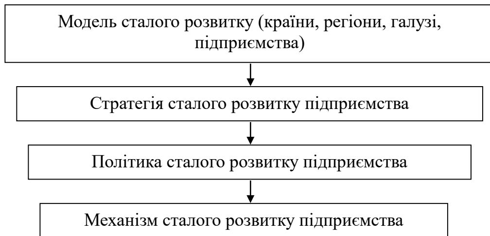
Рис. 1. Ієрархічне співвідношення основних категорій сталого розвитку підприємства