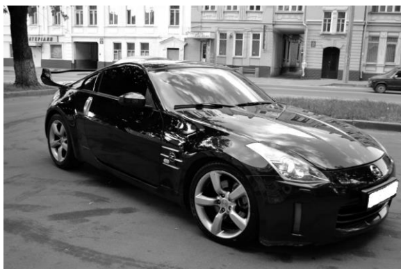
Рис. 1. Експериментальний автомобіль моделі Nissan 350Z

В якості експериментального автомобіля було вибрано Nissan 350Z. Для початку варто відзначити, що автомобіль моделі Nissan 350Z (рис. 1) – зовсім не купе. Задні стійки з'єднує потужна розпірка, замаскована елегантною накладкою. Двигун знаходиться в базі за передніми колесами, що забезпечує майже ідеальну рівновагу по осях. Силовий агрегат – вдосконалена версія відомого мотора V6 VQ35 об'ємом 3,5л. Інженери внесли зміни в електронний блок керування, удосконалили впуск, випуск і висоту підйому клапанів.