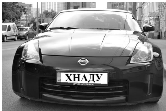
Рис. 2. Передні фари автомобіля

Безперечні удачі даної моделі це ефектна світлотехніка і рельєфний капот. На рис. 2 зображена передня частина автомобіля та передні фари.