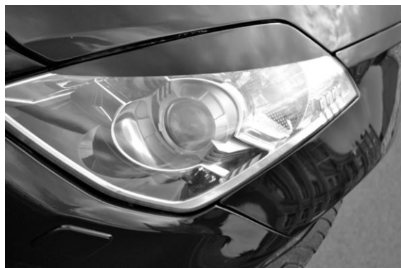
Рис. 3. Бі-ксенонові фари LPN1 03 і LPN1 04

Автомобіль Nissan 350Z можна охарактеризувати як міцно збитий автомобіль, з довгим капотом і краплевидної кабіною. Маленькі ксенонові прожектори встановлені у вузькі прорізи дефлекторів перед колісними арками. На моделі автомобіля Nissan 350Z встановлені бі-ксенонові фари LPN1 03 і LPN1 04 представлені на рис. 3.