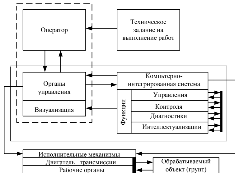
Рис. 1. Структурная схема управления технологической машиной

масс – это, весьма характерно для таких машин как трубоукладчики, автогрейдеры и др. Геометрические модели – это, по сути, чертёжно-конструкторские документы, на которых условными изображениями показаны свойства деталей, узлов и машины в целом.