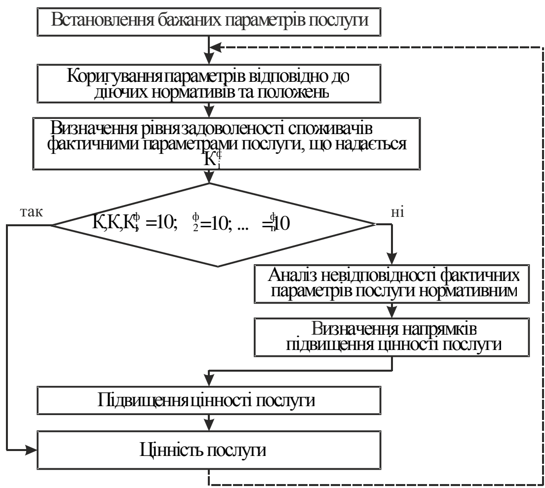
Рис. 1. Схема алгоритму процесу формування цінності послуг пасажирського автомобільного транспорту

В результаті маркетингового дослідження, що проводилося на міському автобусному маршруті № 47 «ХБК–АС Центр» м. Донецька в рамках державної теми «Організація міських пасажирських перевезень» № 0107U002151, отримано такі бажані параметри послуги, що визначають її цінність (табл. 1).