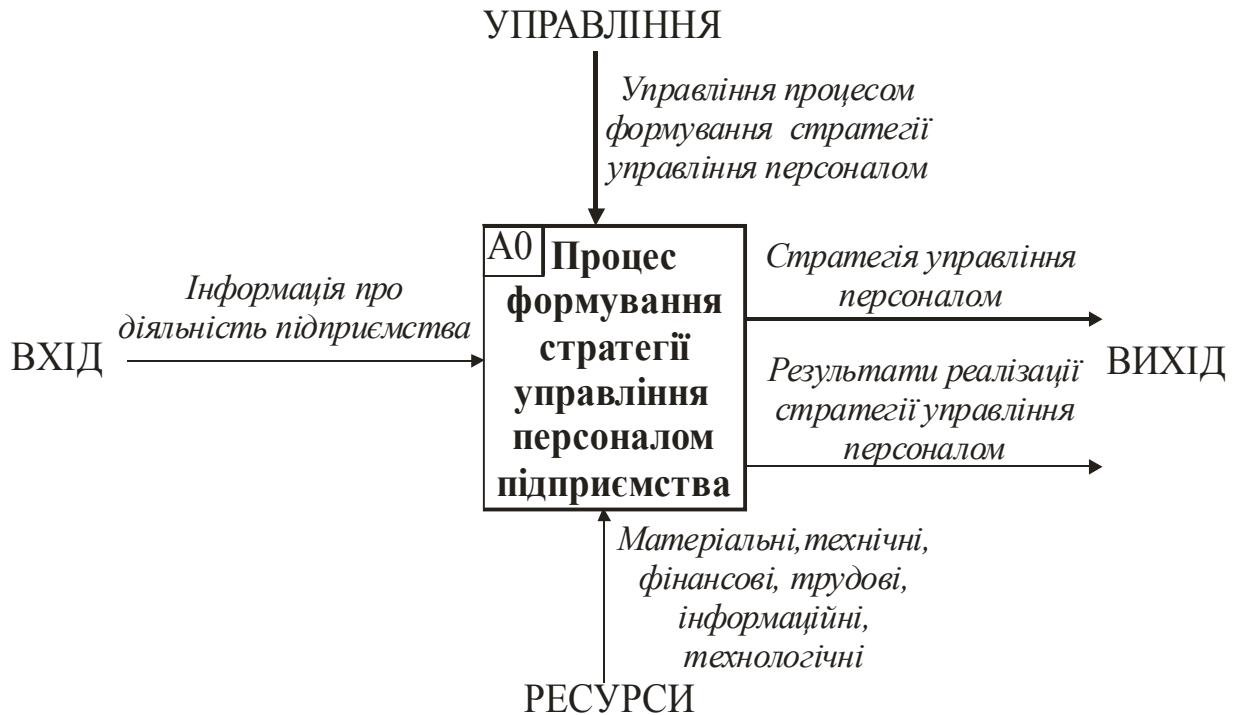
Рис. 1. Контекстна діаграма процесу формування стратегій управління персоналом підприємства

«Входом» у процес формування стратегії управління персоналом є інформація про роботу підприємства, що містить відомості про види його діяльності та стан їх розвитку, характер трудового колективу та ін. «Виходом» або його результатом є власне сформульована стратегія управління персоналом підприємства та результати її реалізації. Так, наприклад, результатами можуть бути підвищення кваліфікації персоналу, продуктивності його праці, ефективності використання, фінансових показників роботи тощо.