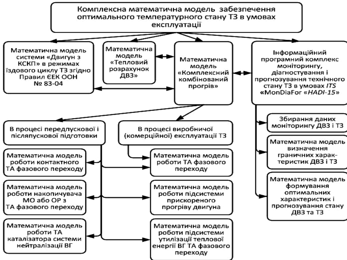
Рис. 3. Складові комплексної математичної моделі забезпечення оптимального температурного стану ТЗ в умовах експлуатації

Інформаційний програмний комплекс моніторингу, діагностування і прогнозування технічного стану ТЗ в умовах ІТS «MonDiaFor «HADI-15»» включає в себе такі підсистеми: – збирання даних моніторингу ДВЗ і ТЗ; – математична модель визначення граничних характеристик ДВЗ і ТЗ; – математична модель формування оптимальних характеристик і прогнозування стану ДВЗ та ТЗ.