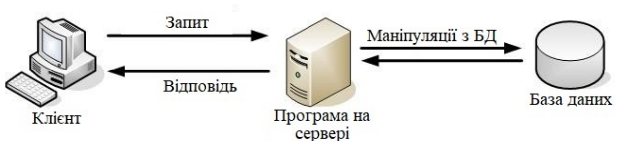
Рисунок 1 – Технологія «Клієнт – сервер»

«Клієнт – сервер» – це архітектура програмного комплексу, в якій відбувається розподіл програми на два логічні компоненти (клієнт і сервер), які взаємодіють за схемою «запит – відповідь» і вирішують певні завдання (рис. 1) [2].