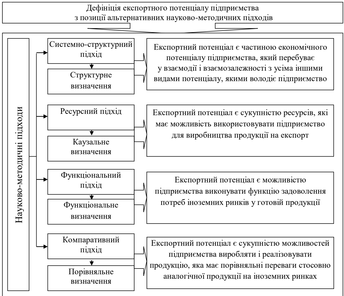
Рис. 1. Удосконалення теоретико-методичних основ експортного потенціалу підприємства з позиції альтернативних науково-методичних підходів