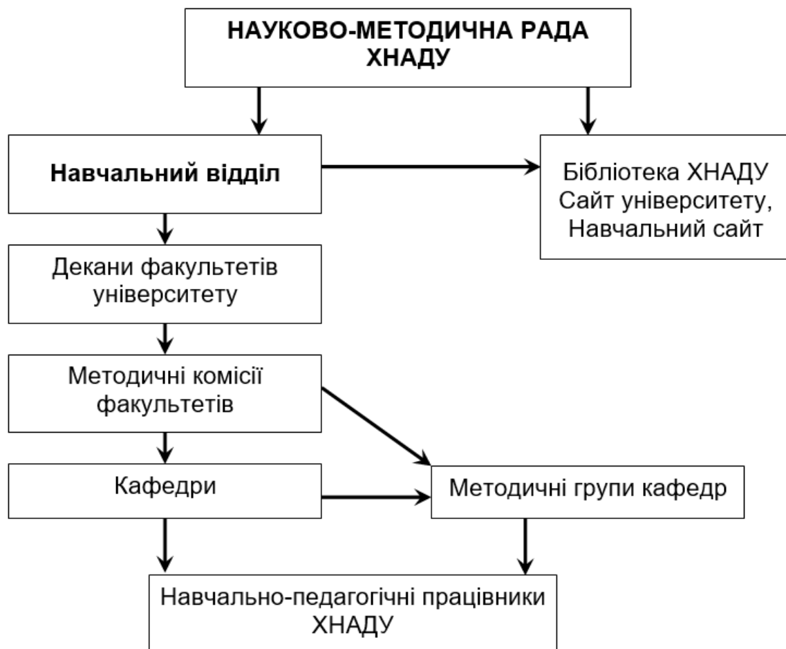
Рисунок 2 - Схема забезпечення організації самостійної роботи здобувачів у ХНАДУ (складено авторами за [2, 3])