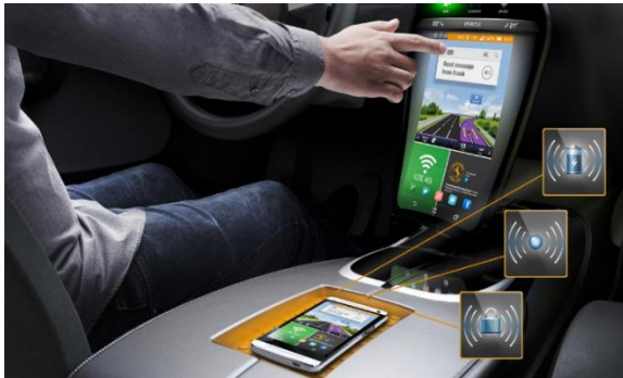
Рис. 2. Сенсорний дисплей, пов'язаний зі смартфоном

Бортовий комп'ютер подає інформацію на сенсорний дисплей з програмованими віртуальними органами управління, та налагоджує зв'язок з мобільними системами водія, наприклад, зі смартфоном (рис. 2). Відповідне програмне забезпечення зробило сучасні гаджети частиною автомобільної інформаційної системи [6].