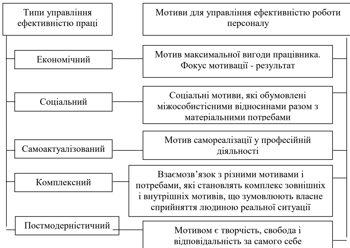
Рис. 1. Хронологічна і змістова динаміка зміни форм управління ефективністю роботи персоналу

Е. Кірхлер, К. Майер-Пести, Е. Хофман [1], вивчаючи питання динаміки змін у механізмах психологічного впливу на ефективність праці, визначили певні стадії цих змін, які відрізняються особливостями уявлень про людину. Ці особливості впливають на форми управління ефективністю діяльності працівників підприємства. Хронологічну і змістову динаміку цих змін показано на рис. 1.