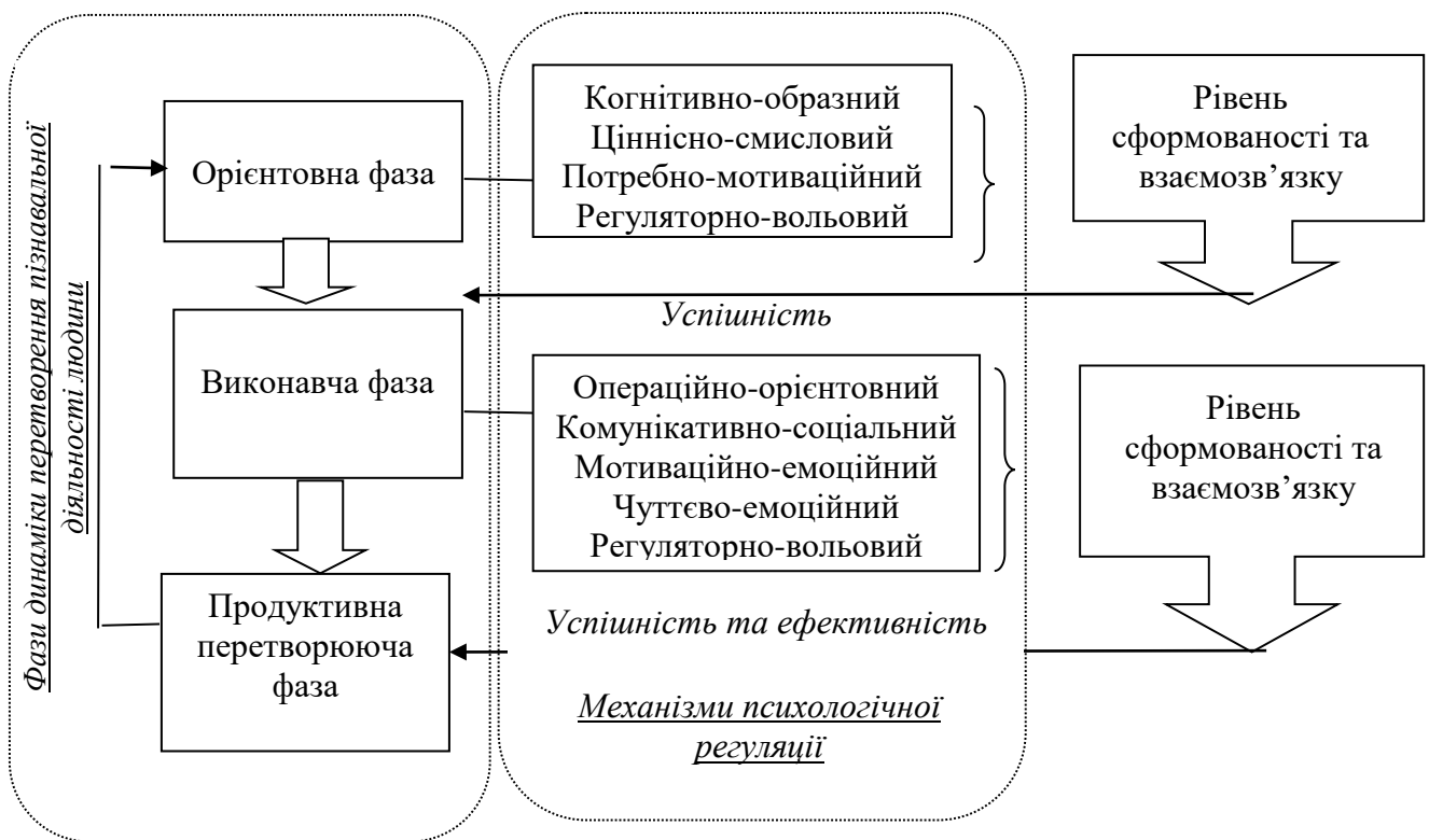
Рис. 4. Психологічний механізм підвищення ефективності праці персоналу підприємства

У систему засобів для підвищення ефективності діяльності персоналу підприємства має входити система мотивації зі стимулюючими бонусами та санкціями, можливість індивідуального планування роботи, створення позитивної атмосфери в колективі, правильна постановка цілей, створення системи оцінки діяльності співробітників тощо.