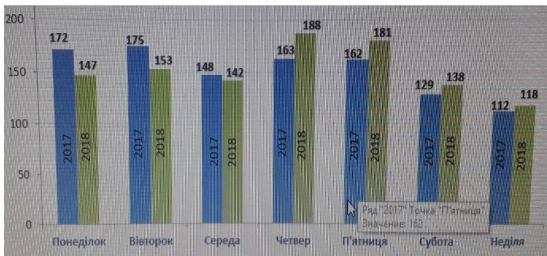
Рисунок 2 - Динаміка ДТП по днях в порівнянні з попереднім роком.

Розглядаючи частоту виникнення ситуацій в залежності від днів тижня бачимо що у 2018 році найбільш небезпечними стали четвер і п'ятниця, на відміну від понеділка і вівторка у 2017 році. (рис. 2).