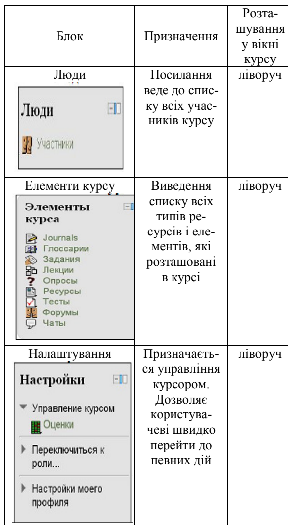
Таблиця 1 – Елементи дистанційного курсу

Курс поділений на тижні відповідно до графіка навчального процесу в семестрі. Для зручності лекційний матеріал розподілений за окремими питаннями плану лекції. Також представлені презентації, які є відеорядом до кожного лекційного заняття. Логічна схема побудови електронних лекційних презентацій, застосовувана для всього курсу хімії, полягає в такому: перший слайд – це завжди тема лекції; другий – план проведення лекційного заняття або загальне пояснення до теми; наступні слайди містять ілюстрації, приклади практичного застосування об'єкта вивчення; зразки тестових завдань з досліджуваного блоку дисципліни; останній слайд – підсумок, тобто виділяється те головне, що повинно бути зрозуміле й залишитися в пам'яті.