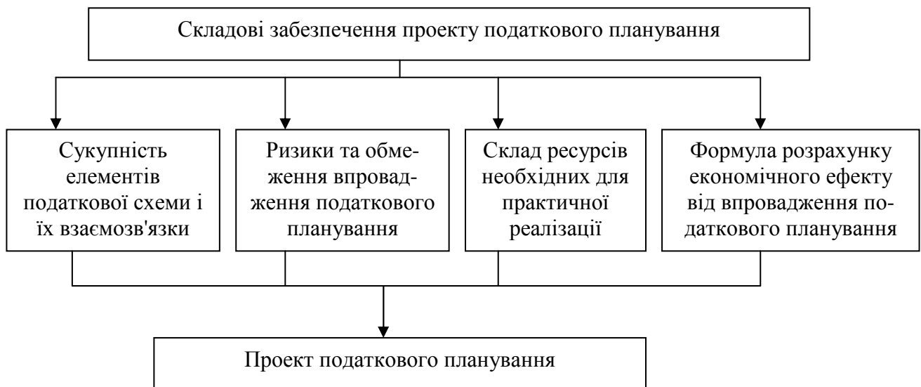
Рисунок 1 – Проектний підхід до процесу податкового планування