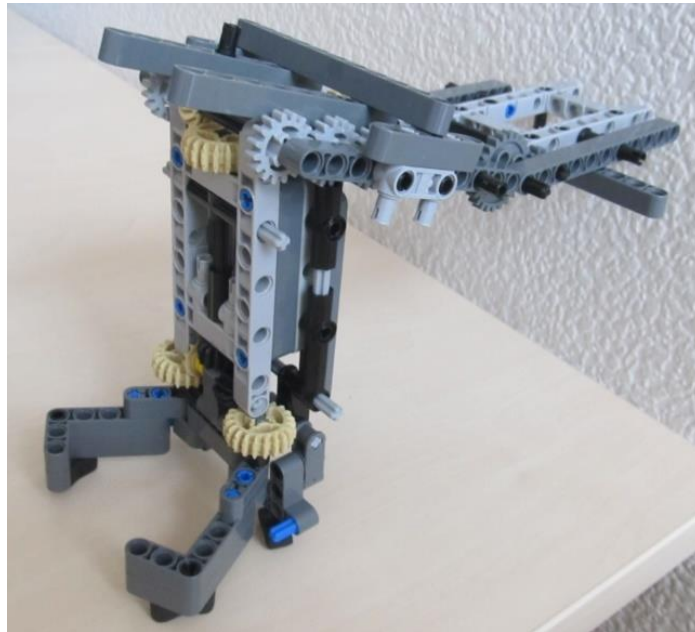
Рисунок 2 – Модель маніпулятора робота навантажувача

Розробка конструкції маніпулятора проводиться шляхом аналізу існуючих аналогів і синтезу нового маніпуляційного механізму. Для перевірки якості розробленої конструкції доцільно створити модель, яка у ході експериментального дослідження буде вдосконалена.