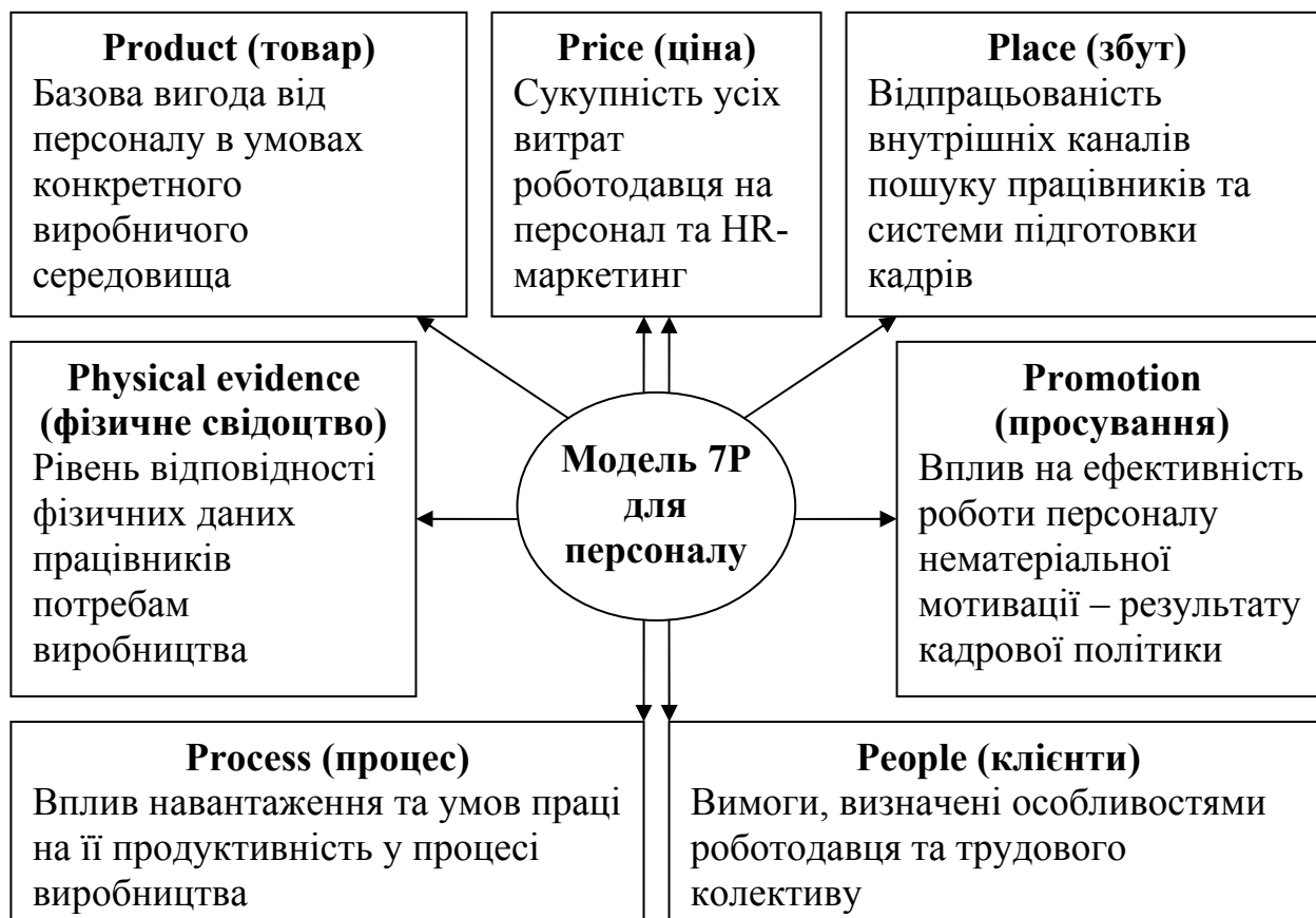
Рис. 2. Модель комплексу маркетингу для персоналу (розроблено автором)

В моделі 7P для маркетингу персоналу елементи ті самі, але їх зміст дещо відрізняється (рис. 2):