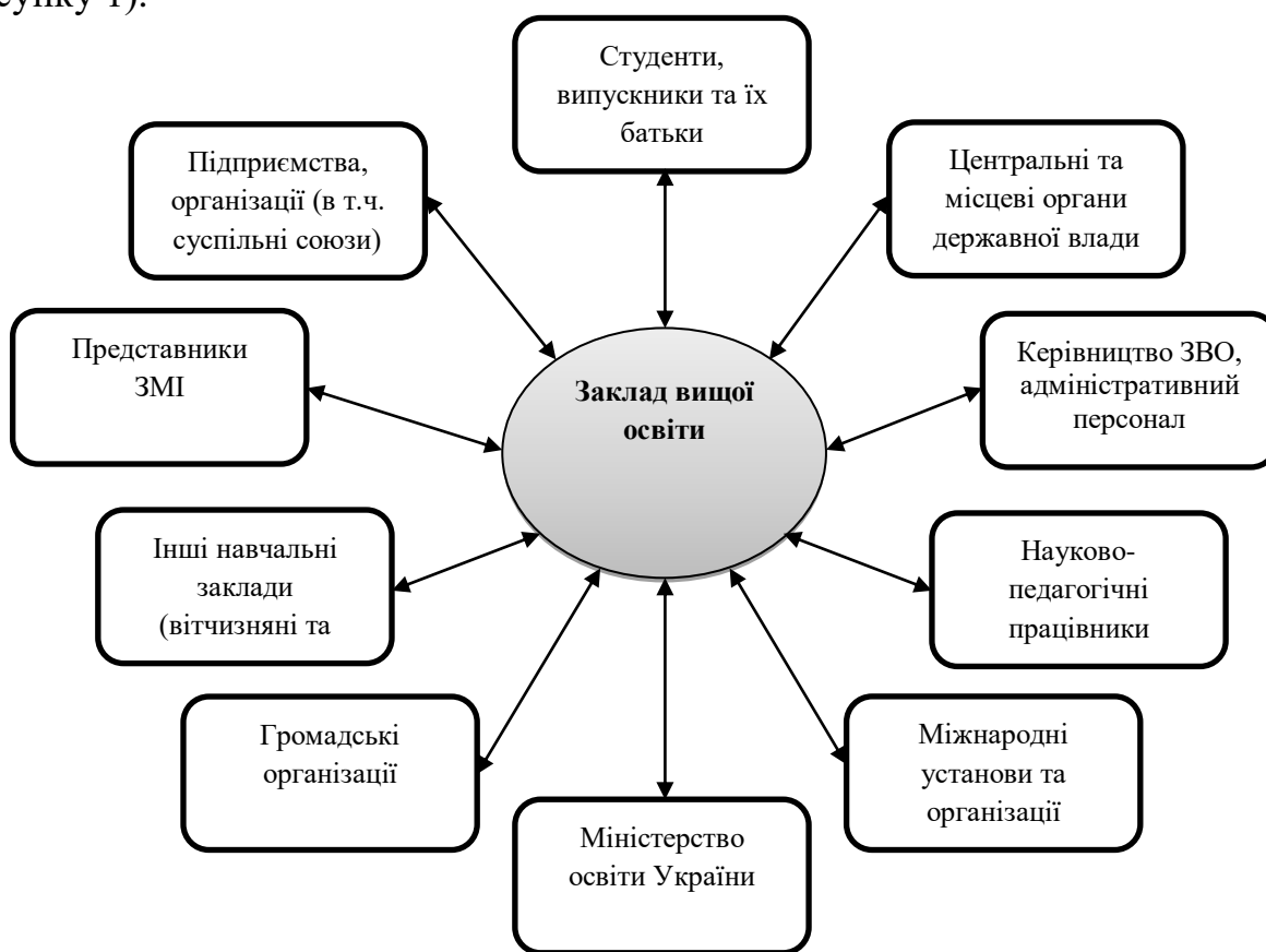
Рис. 1. Категорії стейкхолдерів, з якими взаємодіє заклад вищої освіти (розробка автора)

Перейдемо безпосередньо до виокремлення категорій стейкхолдерів з якими взаємодіє заклад вищої освіти, що допоможе нам більш детально розглянути питання формування бізнес середовища в ЗВО (схема зображена на рисунку 1).